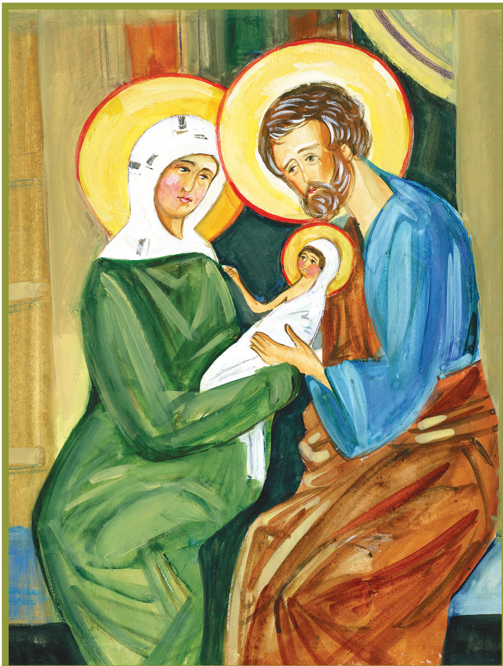
Рождество Пресвятой Богородицы