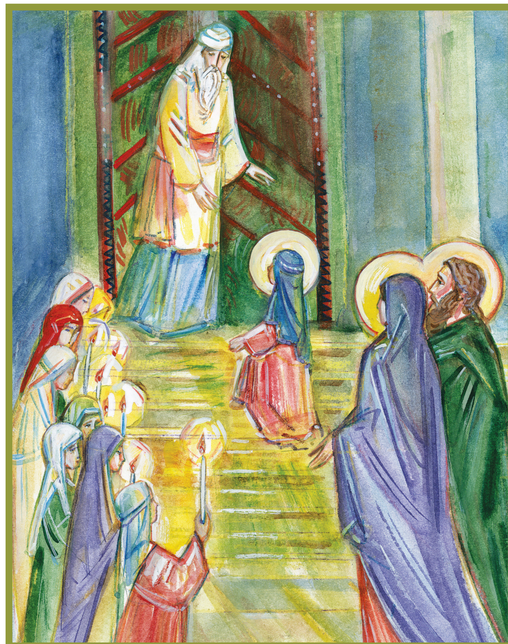
Введение во Храм Пресвятой Богородицы

Навстречу им вышли с пением из Храма священники во главе с первосвященником. Иоаким и Анна с благоговейными молитвами поставили