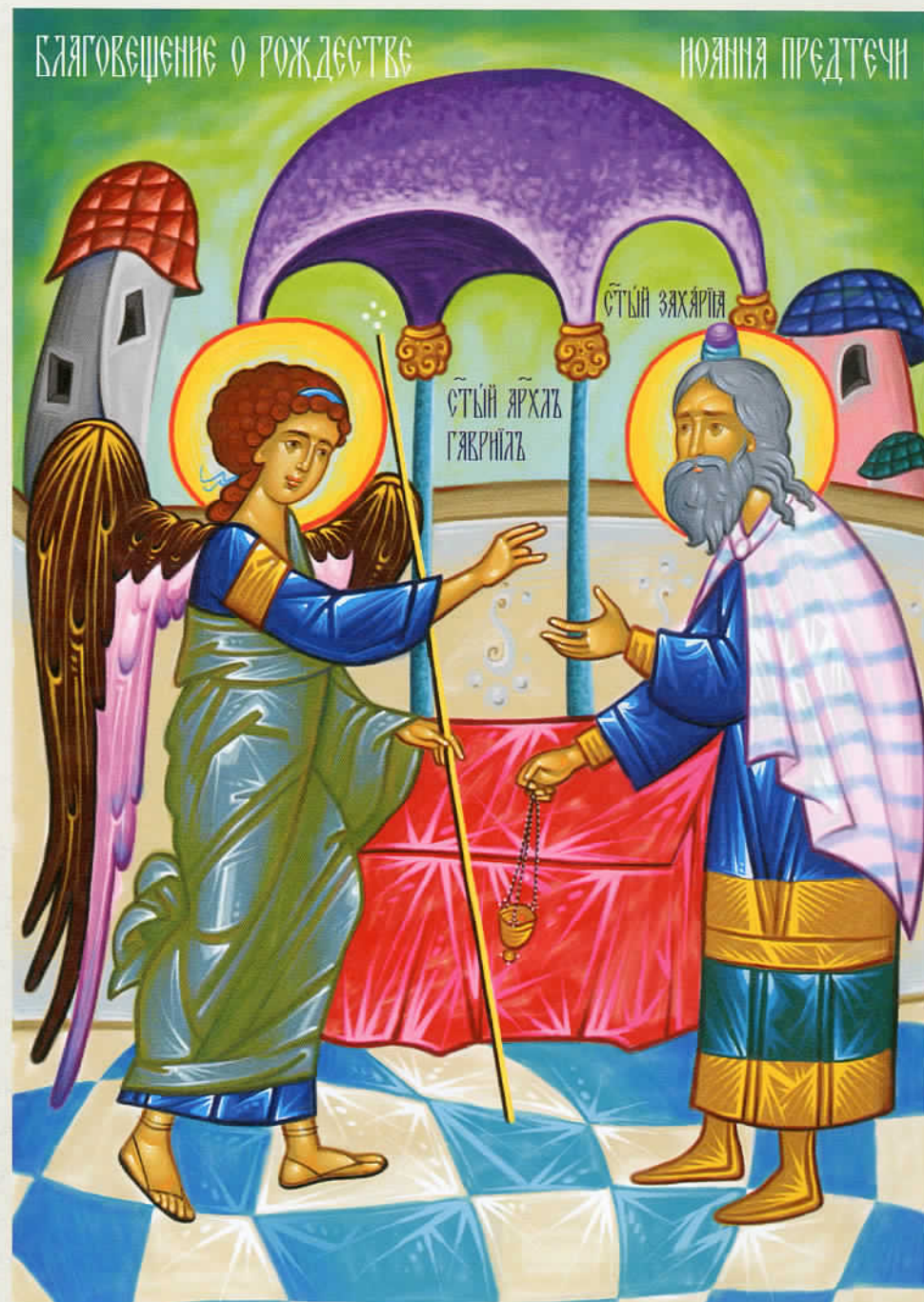
Евангелие от Луки, глава 1, стихи 5-25, 57-64

Как предсказывал ангел, в срок Елизавета родила мальчика, Захария назвал его Иоанном, и немота в тот же миг исчезла.